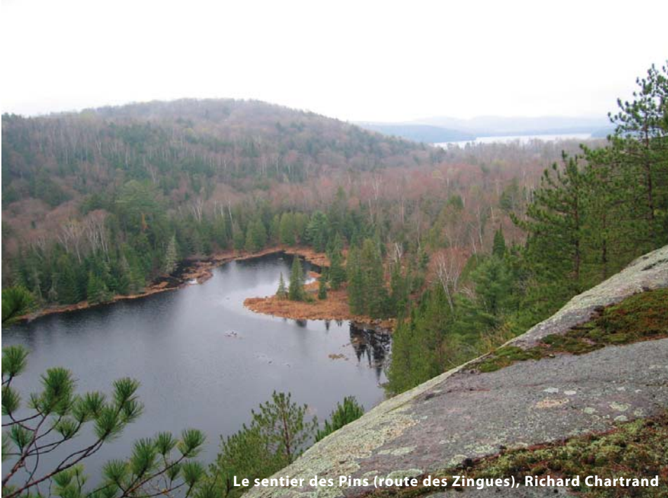
Le sentier des Pins (route des Zingues), Richard Chartrand