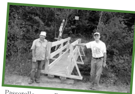
Passerelle, zone Brompton