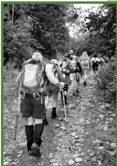
Inauguration Sentier Wabenaki 2010 Sentier national en Mauricie

Voici l'état d'avancement selon les régions, incluant les axes secondaires :